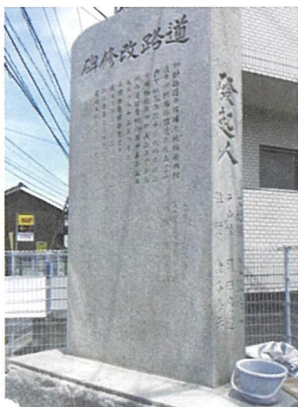
修復前の石碑。文字が薄く見えづらい。

「道路改修碑」の内容をみますと、明治以降のこの辺りの繋がりと近代化を考えるうえで大変参考になります。この石碑はこれからも地域の人々の様々な人生を見つめて行くことでしょう。