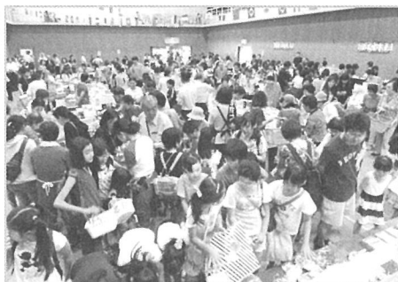
お目当ての品はみつかりましたか？ バザー会場