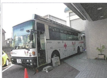
古田公民館玄関前の献血車

11月4日(金)、古田公民館を会場に9時から12時まで。古田学区ではあらかじめ掲示板や回覧板で献血のお知らせをしました。当日も女性会が呼びかけや会場での案内をしました。 ※献血された方のコメント 「昨年も来たのですが、献血できませんでした。今年は、体に気を付けて献血することができてうれしかったです。」