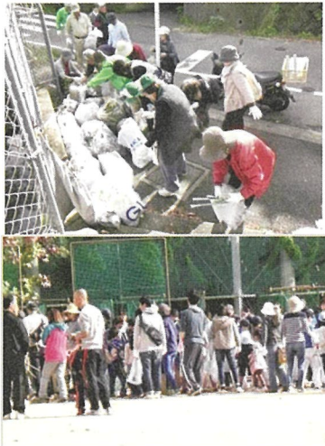
集めたゴミを分別