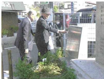
新しく設置された石碑の説明板

長年の風雪に耐えた石碑。このたび工事を担当した石屋さんによると石は極めて大きく良いものだそうです。