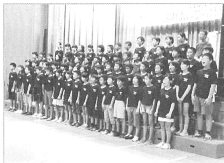
古田小学校6年生有志の合唱 ステージ