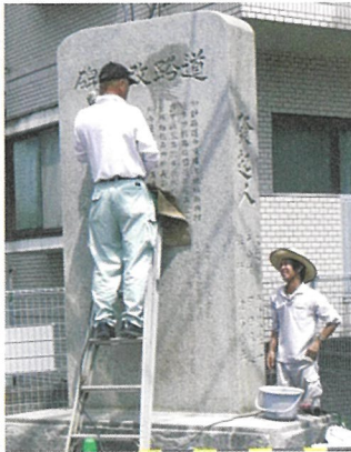
修復中の石碑。水洗いしています