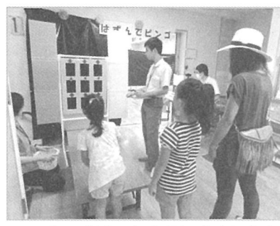
ビンゴゲームは楽しめましたか 児童館「あそびランド」