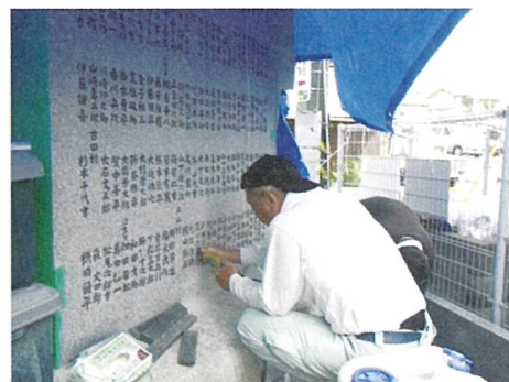
薄くなっていた文字に墨入れ