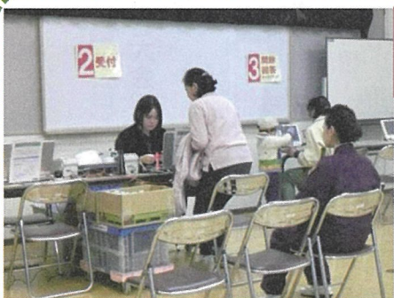
問診票記入→受付→問診回答→血圧測定→血液検査→献血へ